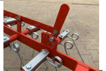
Front Wiesenstriegel 300cm 3m Frontstriegel Striegel Schleppe NEU