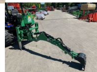
Anbaubagger Heckbagger Geo BH5R-HSX