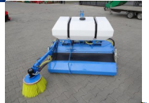
Kehrmaschine 150 Kkehrbürste Kkehrbesen Traktor NEU