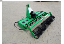
Kreiselegge Geo MG210 RC