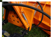
Federklappenschneeschild City 120cm