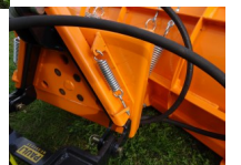
Federklappenschneeschild City 180cm