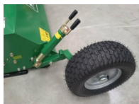
Quad-ATV Mulcher Geo ATV145 KD Plus