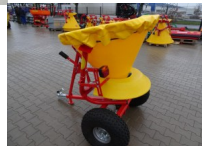
Streuer Salzstreuer Düngerstreuer 300 Liter Profi Quad ATV