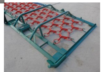
Wiesenschleppe Wiesenegge Profi 4m-3-reihig